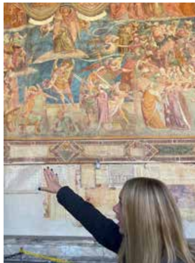
Visita guidata in TEDESCO presso il Camposanto Monumentale di Pisa.

Campionesse Provinciali Juniores di Pallavolo 2012