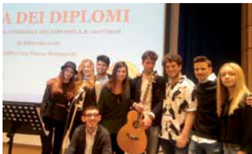
Band - Voci e suoni del Cattaneo