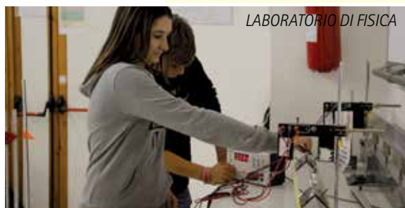
LABORATORIO DI FISICA

È previsto l'insegnamento di EDUCAZIONE CIVICA come disciplina trasversale di almeno 33 ore annue.