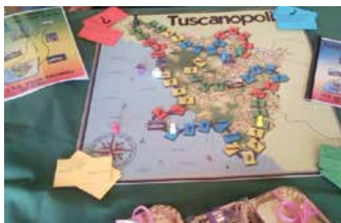
"Tuscanopoly" il gioco con cui la 4B Amm. Fin. e Marketing si è classificata al secondo posto in Italia nel 2010