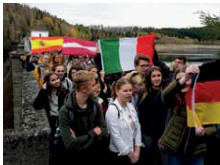
Ottobre 2019 – Alunni del CORSO TURISMO sfilano con i partner europei in GERMANIA