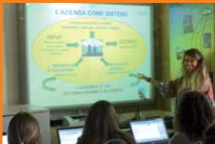
AULA TEMATICA di ECONOMIA AZIENDALE