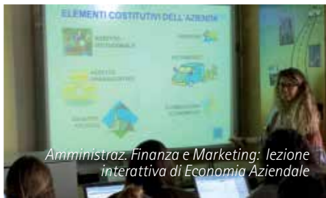
Amministr. Finanza e Marketing: lezione interattiva di Economia Aziendale

Nelle ore di Economia in Laboratorio è utilizzato un SOFTWARE DI CONTABILITÀ AZIENDALE in uso in molti studi commerciali.