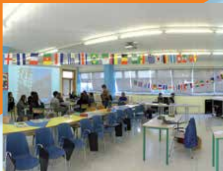
LABORATORIO di LINGUE 1