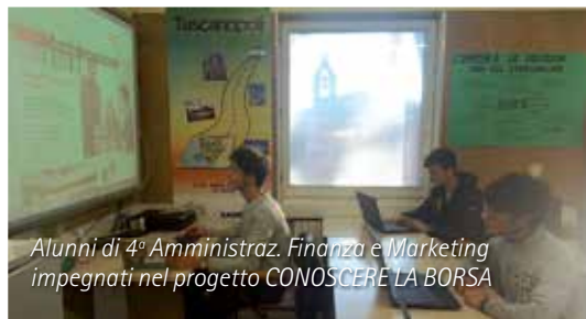
Alunni di 4ª Amministr. Finanza e Marketing impegnati nel progetto CONOSCERE LA BORSA