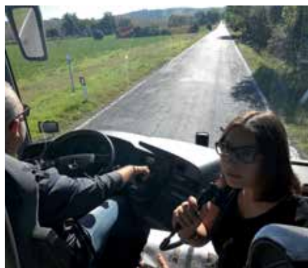
Un' alunna fa da guida in TEDESCO durante uno scambio

Marzo 2019 – Alunni inglesi con alunni del Cattaneo nello scambio bilaterale