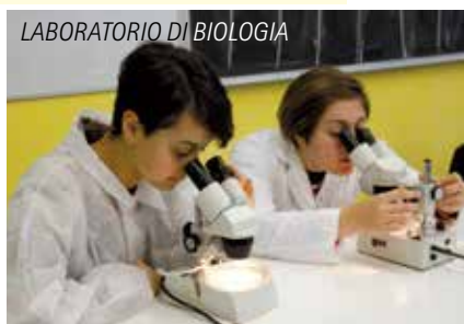
LABORATORIO DI BIOLOGIA