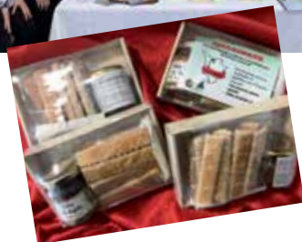
4CA - la mini impresa "Km0 JA" con Tuscanosnack, lo 'snack' a Km0