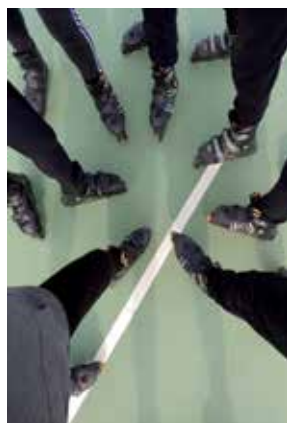
Pattinaggio a CASA BONELLO (Ponte a Egola)