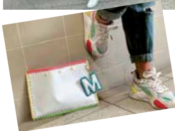
4BA - la mini impresa "Re4banner JA" che ha realizzato la borsa "TECLA"