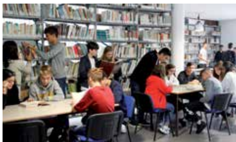
Classe 1CE fa ricerche in biblioteca