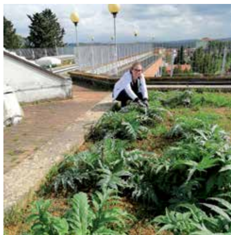
Alunni del biennio lavorano al giardino della Biodiversità sul terrazzo/tetto della scuola: coltivazione dei Carciofi 'grinzosi' di San Miniato