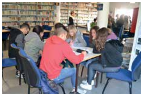
Spettacolo "IO NON ME NE FREGO"