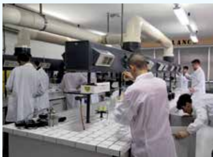
LABORATORIO di CHIMICA del TRIENNIO